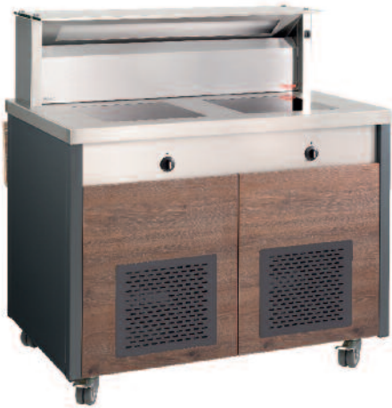
Kochstation Cooking station