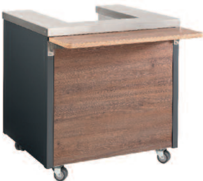
Einfahrnische Drive-in niche