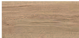
H 1180 Halifax Eiche natur H 1180 Natural Halifax Oak