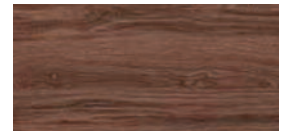
H 3154 Charleston Eiche dunkelbraun Dark Brown Charleston Oak