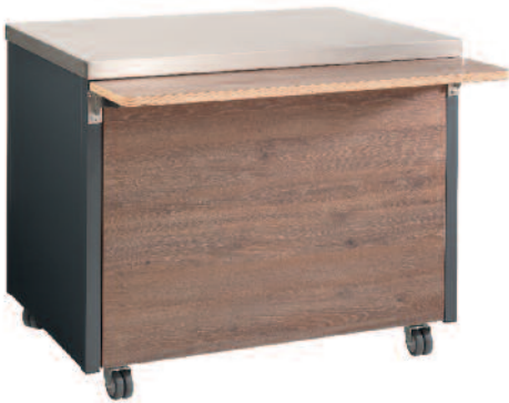
Neutralausgabe modular desk