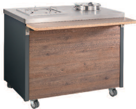
Neutralausgabe mit Zubehör modular desk with accessories