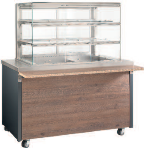
Kaltausgabe Vitrine Cold servery display case