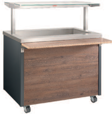
Kalt-Warm-Wanne – steckerfertig 3 x GN 1/1 Hot or cold well – ready to plug-in 3 x GN 1/1