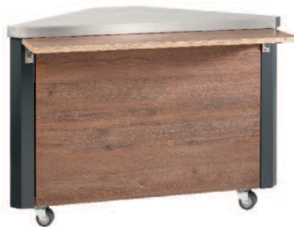
Eckmodul Corner module