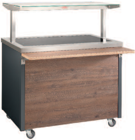
Kalt-Warm-Platte – steckerfertig 3 x GN 1/1 Hot-cold plate – ready to plug-in 3 x GN 1/1