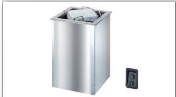
Universal-Tellerspender/Universal plate dispenser