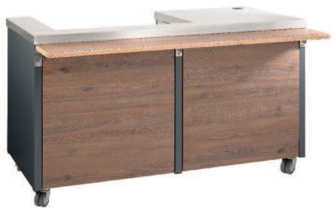
Kassenstand Cashier counter