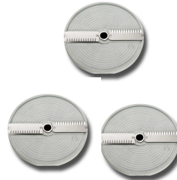
Schneidscheiben für Wellen-/ Bunt- schnitt AW