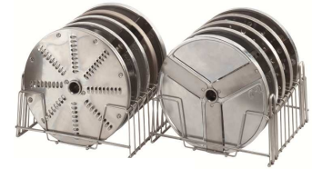
Scheibenständer (für 5-6 Scheiben)