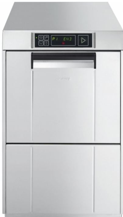
Gläserespülmaschine, doppelwandiges Gehäuse, 400V, Korb 400x400 mm